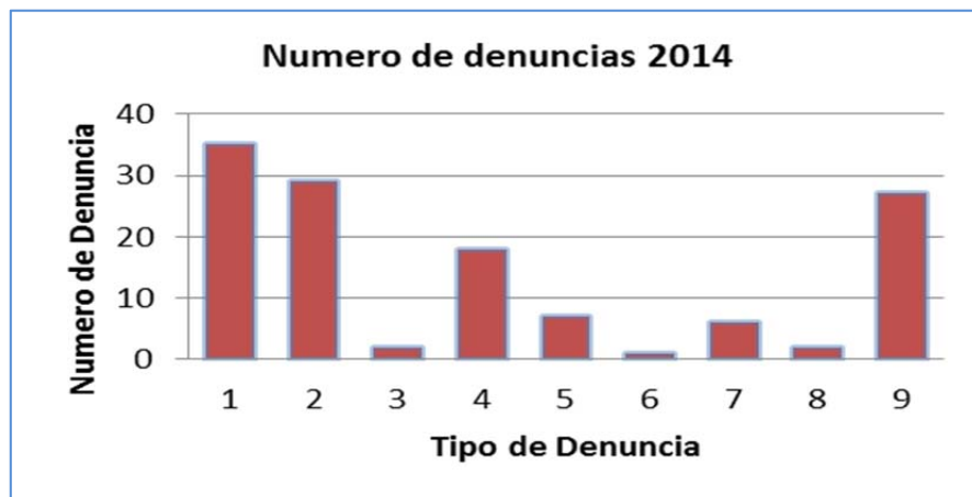
Gráfico N°2: Número de denuncias presentadas durante el año 2015